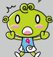
協会けんぽ島根支部 キャラクター しまめちゃん