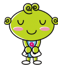
協会けんぽ島根支部キャラクター しまめちゃん

*高齢者医療制度への拠出金は、加入者数等に応じた負担となるため、本来扶養解除となる被扶養者がいる場合は、負担する必要のない拠出金が生じる場合があります。