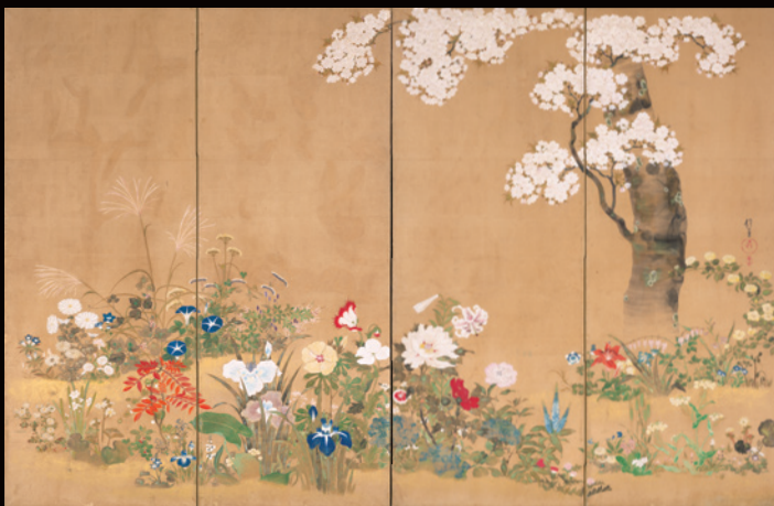
四季花木図屏風 酒井抱一筆 江戸時代【前期展示】