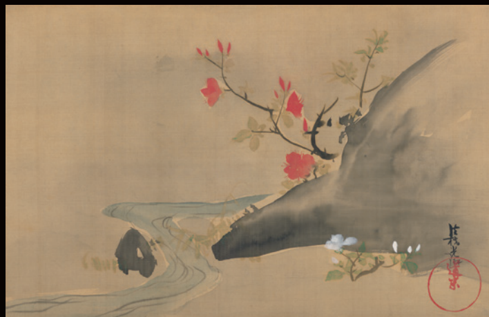
重要文化財 躑躅図 尾形光琳筆 江戸時代【前期展示】