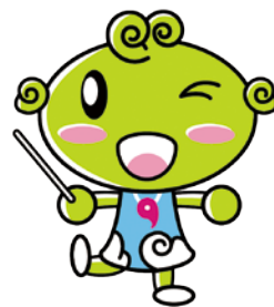
協会けんぽ島根支部キャラクター しまめちゃん

ご退職により、健康保険の加入資格を喪失した場合は、 退職日の翌日(資格喪失日)以降、在職時の保険証は使用できません 。事業所の方は保険証を従業員の方から回収いただき、届出書に添付の上、日本年金機構へご返却ください。