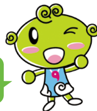
協会けんぽ島根支部キャラクター しまめちゃん

「上手な医療のかかり方」を知り、適正な受診をすることによって、医療費の節約や医療機関の負担軽減等につながるからです！