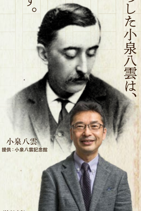
小泉八雲