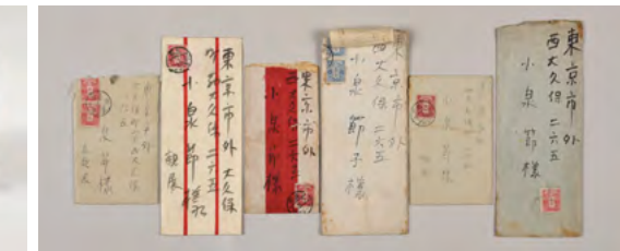
1 小泉清 | ヘルン像 左 | 1950年 | 墨 | 小泉八雲記念館 2 小泉清 | 自画像 | 年代未詳 | 色鉛筆・墨 | 小泉八雲記念館 3 小泉清 | 仁右衛門島 | 1950年 | 水彩 | 小泉八雲記念館 4 小泉清 | 梅林 | 1947年 | 油彩 | 小泉八雲記念館 5 愛用の絵の具箱 | 島根県立美術館 6 母セツ宛書簡 | 池田記念美術館