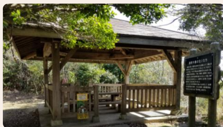
② 馬着山中間の東屋