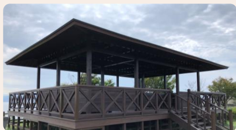
① 五本松公園の東屋