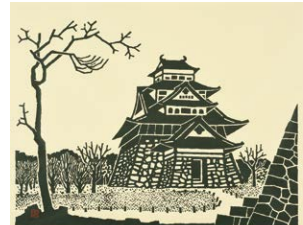
松江城天守閣 昭和6年(1931)