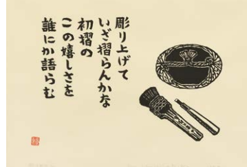
彫り上げて 昭和29年(1954)