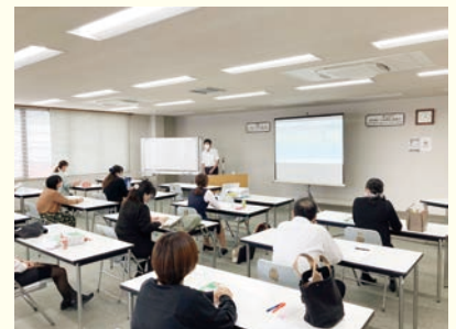
実務講座「健康保険給付」