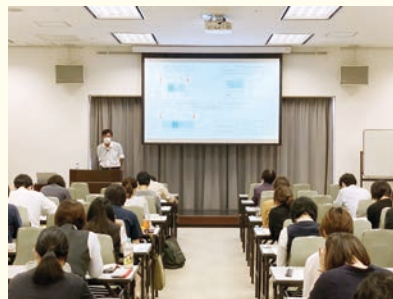
実務講座「社会保険と労働保険」

※各講座にご参加いただいた皆様には、新型コロナウイルス感染症予防対策にご協力いただき、全会場とも無事開催することが出来ました。ありがとうございました。