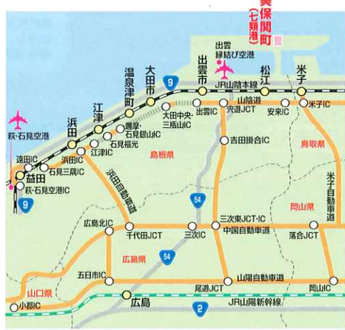
■お車 広島より：約3時間40分 松江より：45分 ※共に有料道路使用