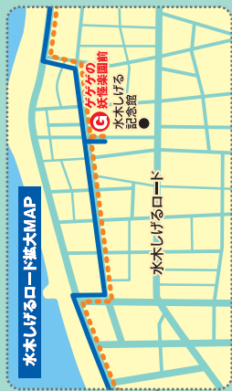
水木しげるロード拡大MAP