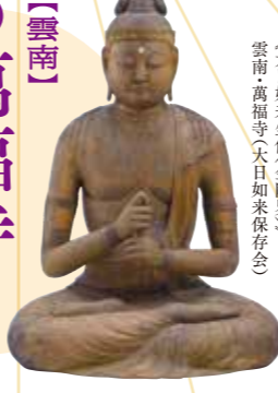
〔鳥根県指定文化財〕 《大日如来坐像(金剛界)》 雲南・萬福寺(大日如来保存会)