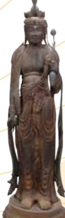
〔重要文化財〕 《十一面観音菩薩立像》 安来・清水寺