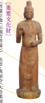
〔重要文化財〕 《菩薩立像(伝観音菩薩)》 出雲・萬福寺(大寺薬師)