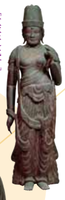
〔重要文化財〕 《菩薩立像(伝虚空藏菩薩)》 松江・佛谷寺