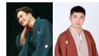
春風亭昇羊 © 武藤宗純美