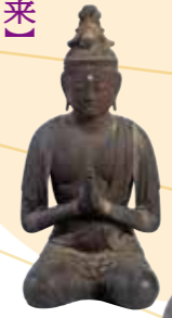
〔重要文化財〕 《阿彌陀三尊像》 安来・清水寺