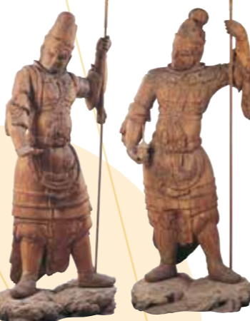
〔重要文化財〕 《四天王立像》 出雲・萬福寺(大寺薬師)