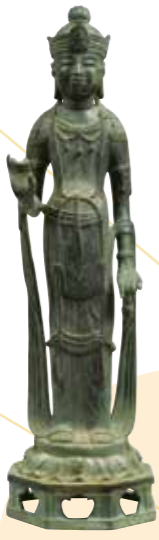
〔重要文化財〕 《観音菩薩立像》 出雲・鰐淵寺