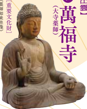
〔重要文化財〕 《薬師如来坐像》 出雲・萬福寺(大寺薬師)