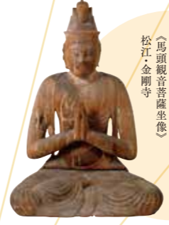
〔島根県指定文化財〕 《馬頭観音菩薩坐像》 松江・金剛寺