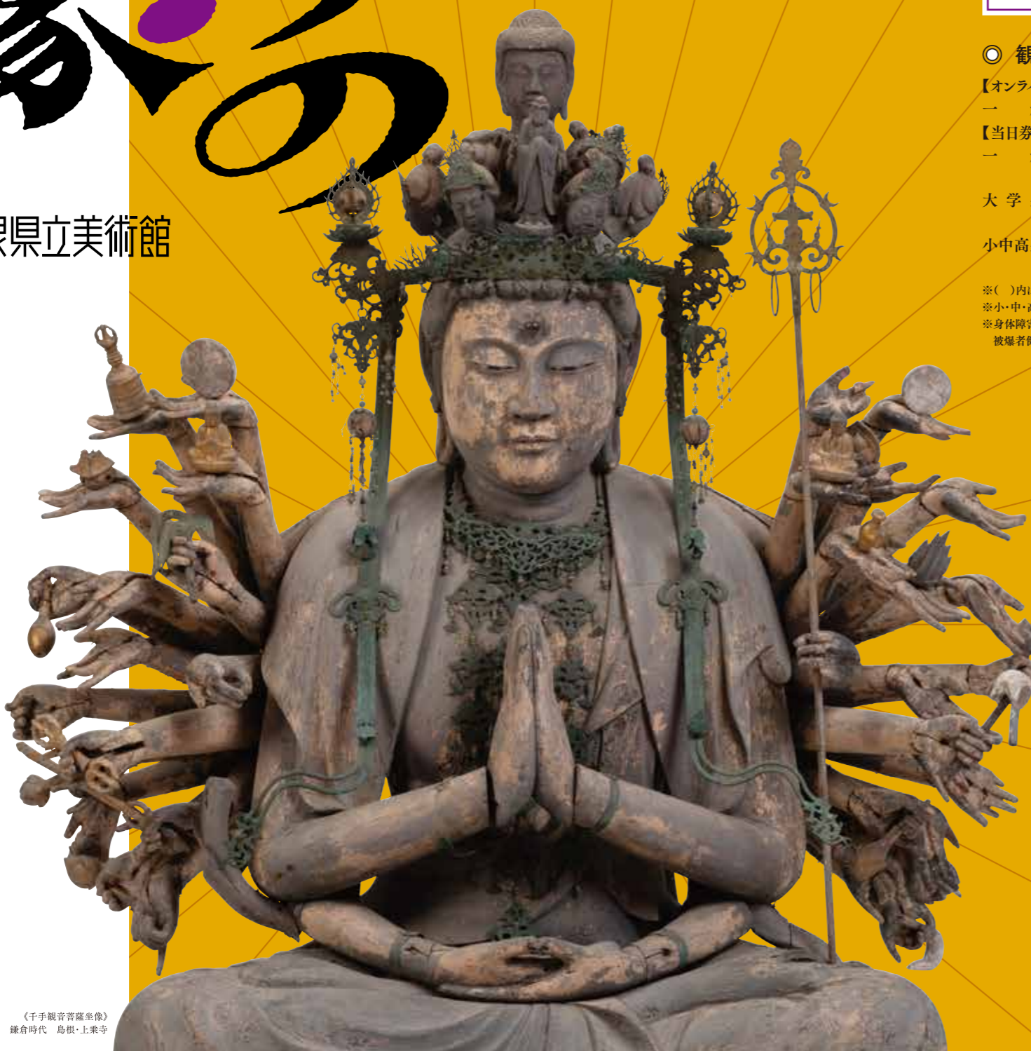
《千手観音菩薩坐像》鎌倉時代 島根・上乗寺