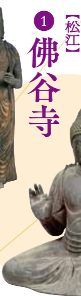
〔重要文化財〕 《菩薩立像(伝観音菩薩)》 松江・佛谷寺