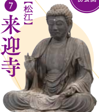
〔松江市指定文化財〕 《阿彌陀如来坐像》 松江・来迎寺