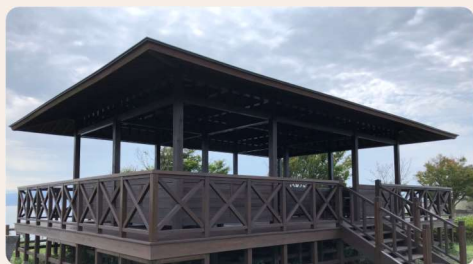
① 五本松公園の東屋