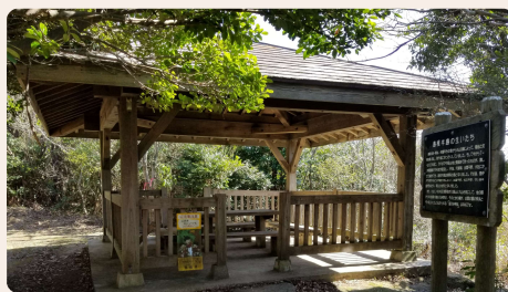
② 馬着山中間の東屋