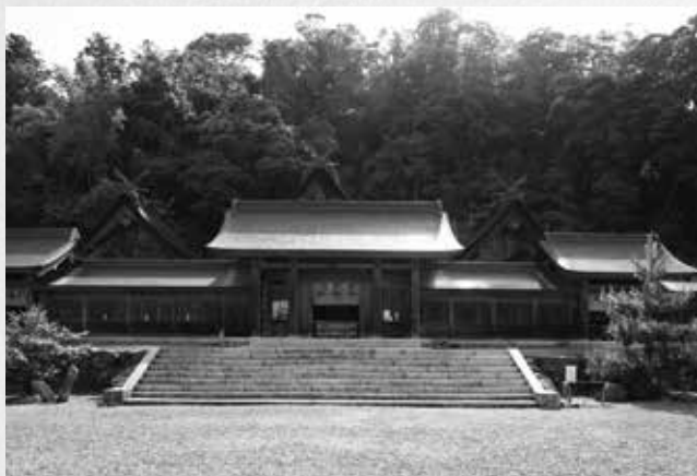
荘厳な出雲造りの御本殿三社[佐太神社] (国指定重要文化財)