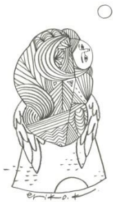
ついたち 朔のカンパーニュ