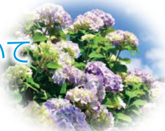
原山雲海ロード (邑南町)

事業主の皆様には、毎年1回、7月1日現在におけるすべての被保険者(社会保険に加入している従業員)の標準報酬月額を決定するために、「算定基礎届」を提出いただいています。今年度の「算定基礎届」につきましては、令和2年6月中旬より、順次、事業主へ送付いたします。