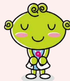
協会けんぽ島根支部キャラクター <しまめちゃん>

令和2年3月31日受診分までは、現行どおり申込みが必要です。すみやかな申込みをお願いいたします。 (受診日2週間前までに、協会けんぽへ提出していただきますよう、お願いいたします。)