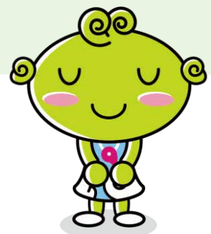
協会けんぽ島根支部キャラクター くしまめちゃん