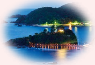
松江市美保関町 明島神社の八朔祭宵宮