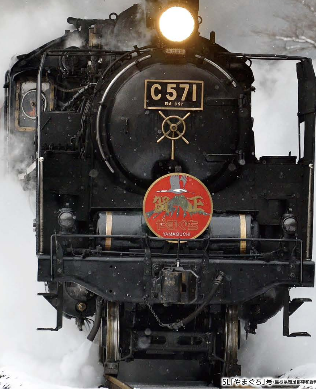
SL「やまぐち」号(島根県鹿足郡津和野町)

1979年の復活以降、多くのSLファンに愛される「やまぐち」号。正月には臨時列車 SL「津和野稻成」号が運行されます。