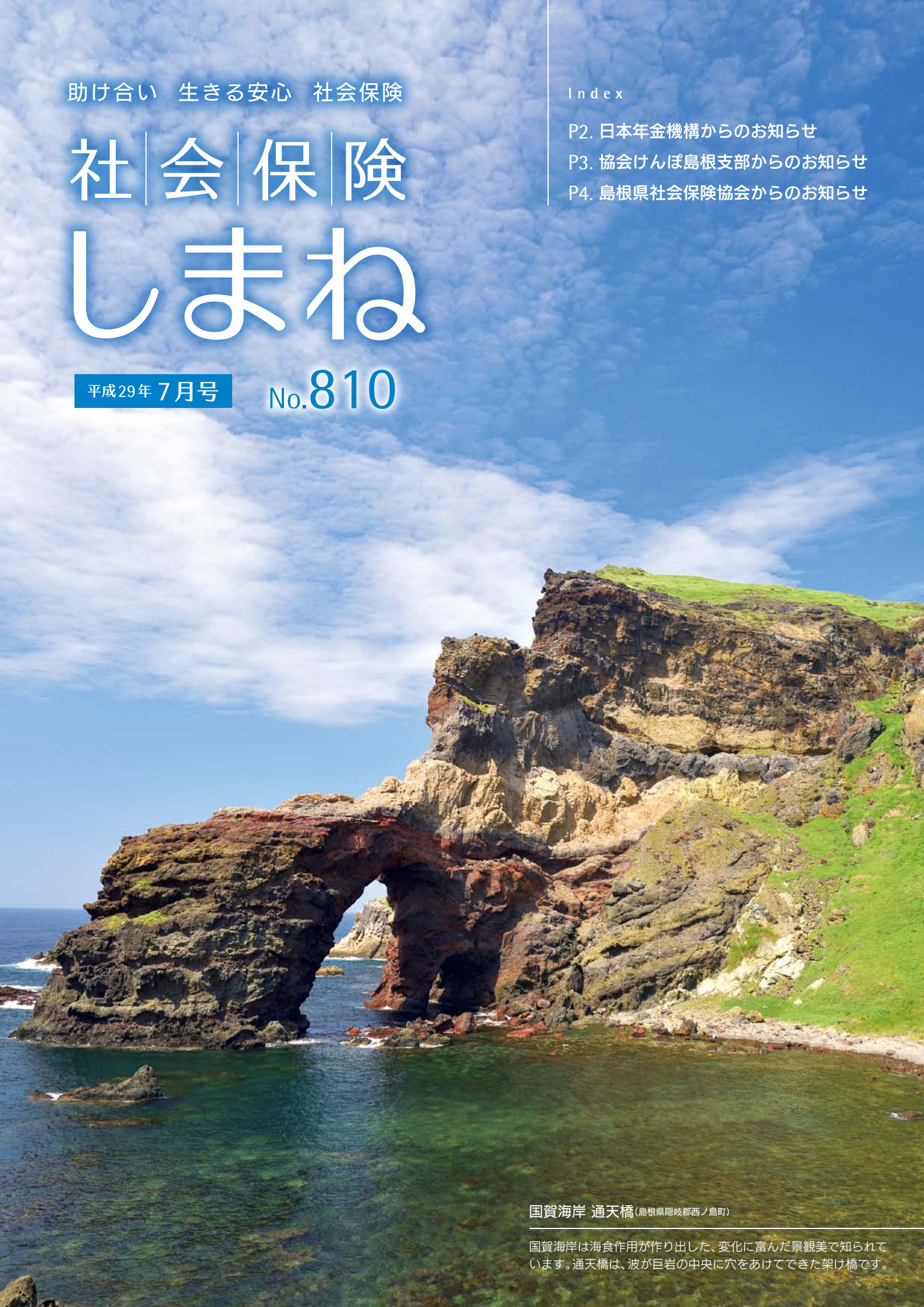
国賀海岸 通天橋 (島根県隠岐郡西ノ島町)

国賀海岸は海食作用が作り出した、変化に富んだ景観美で知られています。通天橋は、波が巨岩の中央に穴をあけてできた架け橋です。