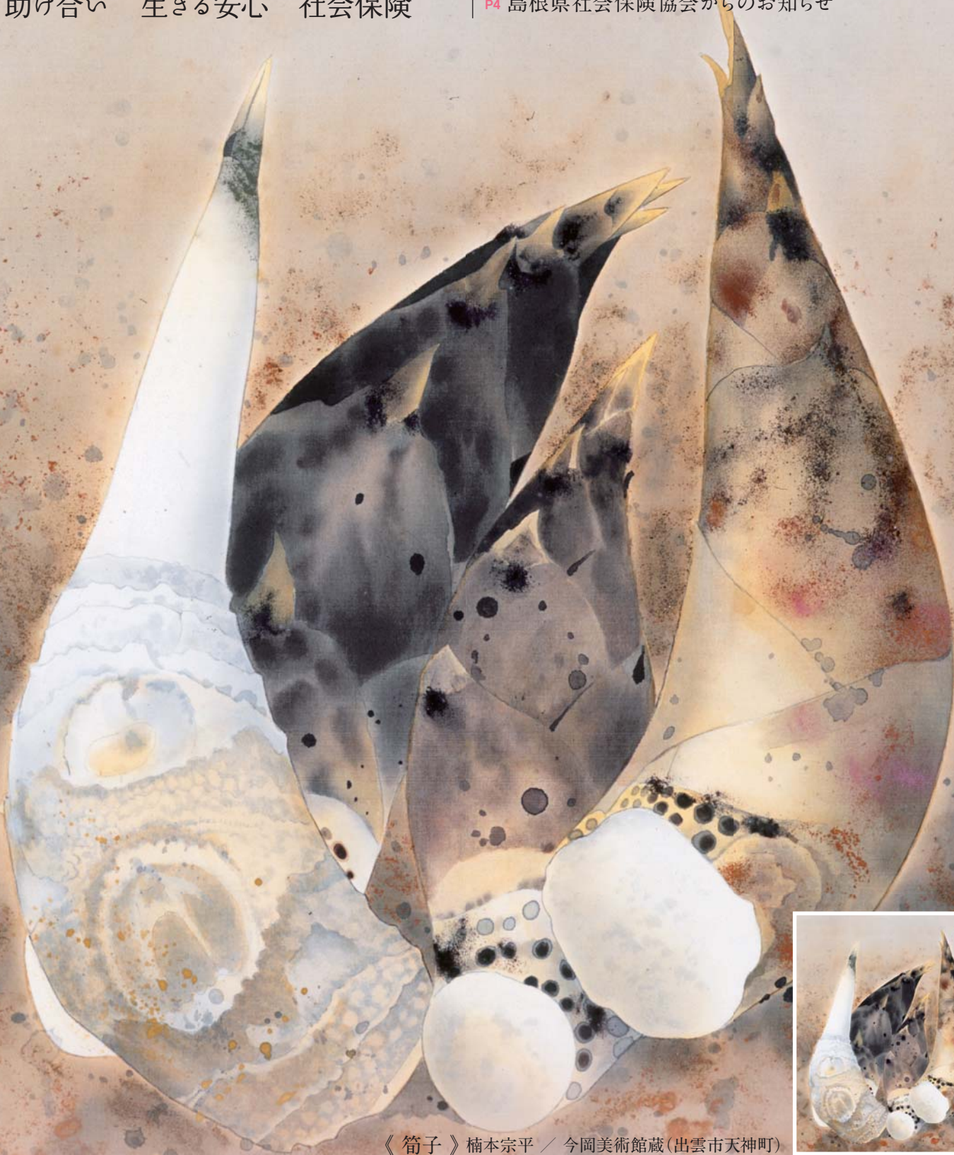
《筍子》楠本宗平 / 今岡美術館蔵(出雲市天神町)