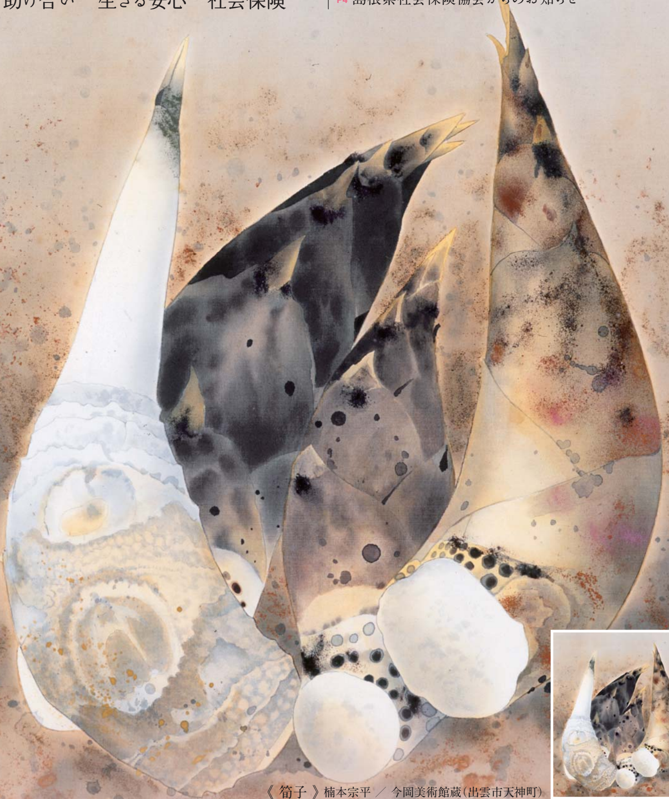
《筍子》楠本宗平 / 今岡美術館蔵(出雲市天神町)