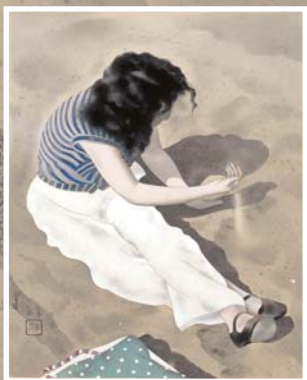
《砂と女》 楠本宗平 / 今岡美術館蔵(出雲市天神町)