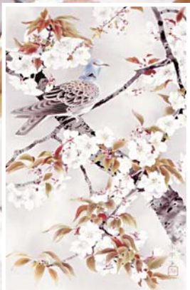
《桜と鳩》楠本宗平 / 今岡美術館蔵(出雲市天神町)