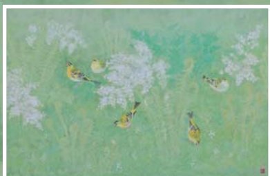
《萌》野々内良樹 / 今岡美術館蔵(出雲市天神町)