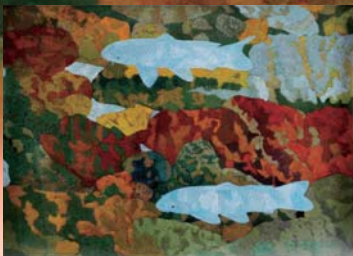
松浦満《流れ》 今岡美術館蔵(出雲市天神町)