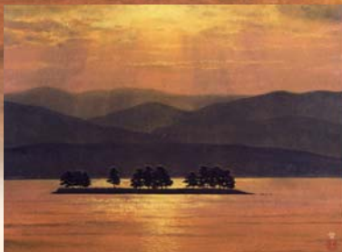
小泉智英《宍道湖夕景》 今岡美術館蔵(出雲市天神町)