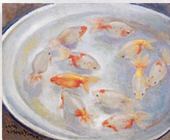
木村義男《出雲なんきん》 今岡美術館蔵(出雲市天神町)