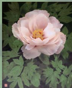
楠本宗平《雨滴》 今岡美術館蔵(出雲市天神町)