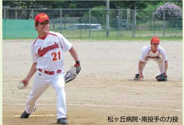
松ヶ丘病院・南投手の力投