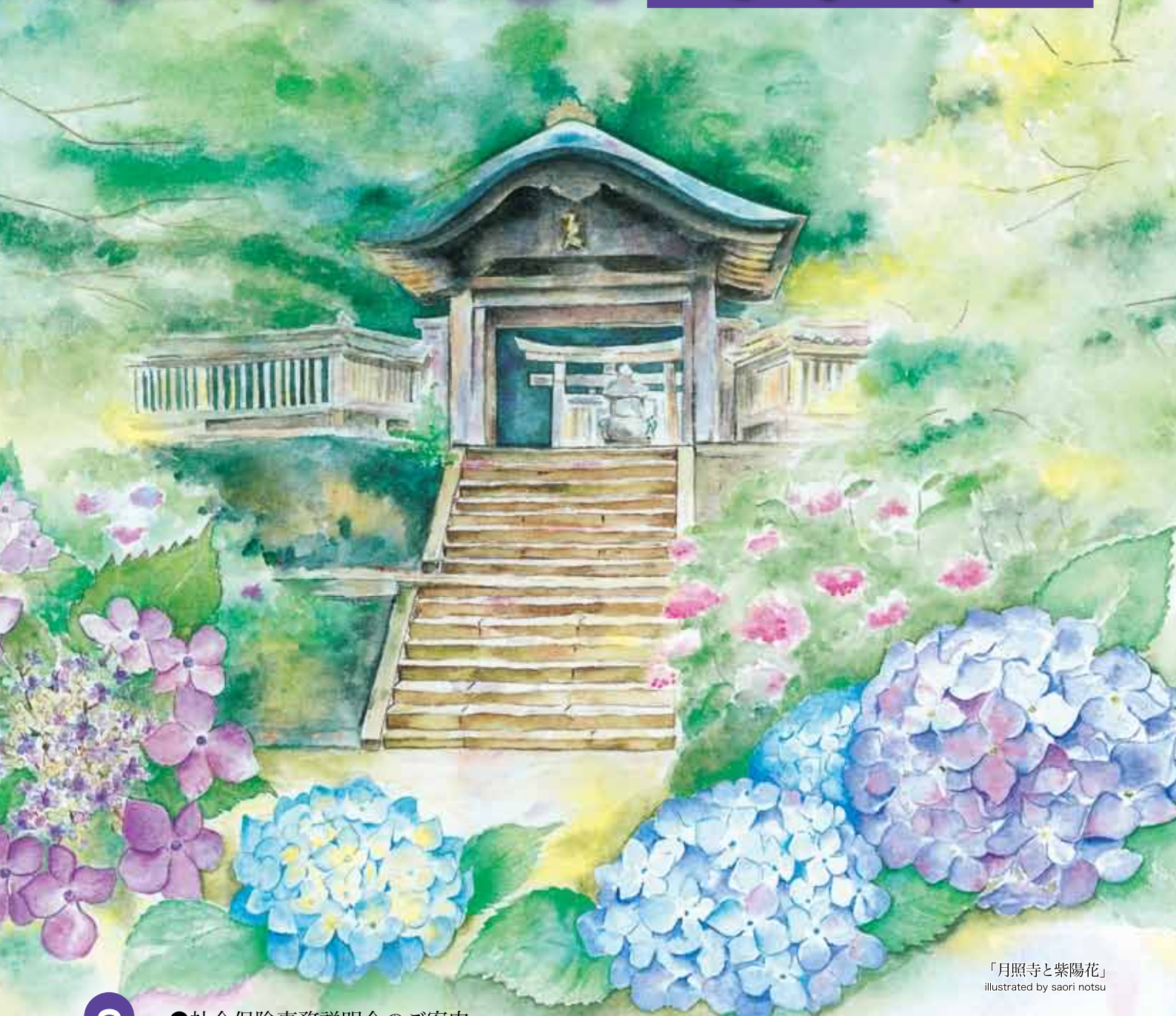
「月照寺と紫陽花」 illustrated by saori notsu