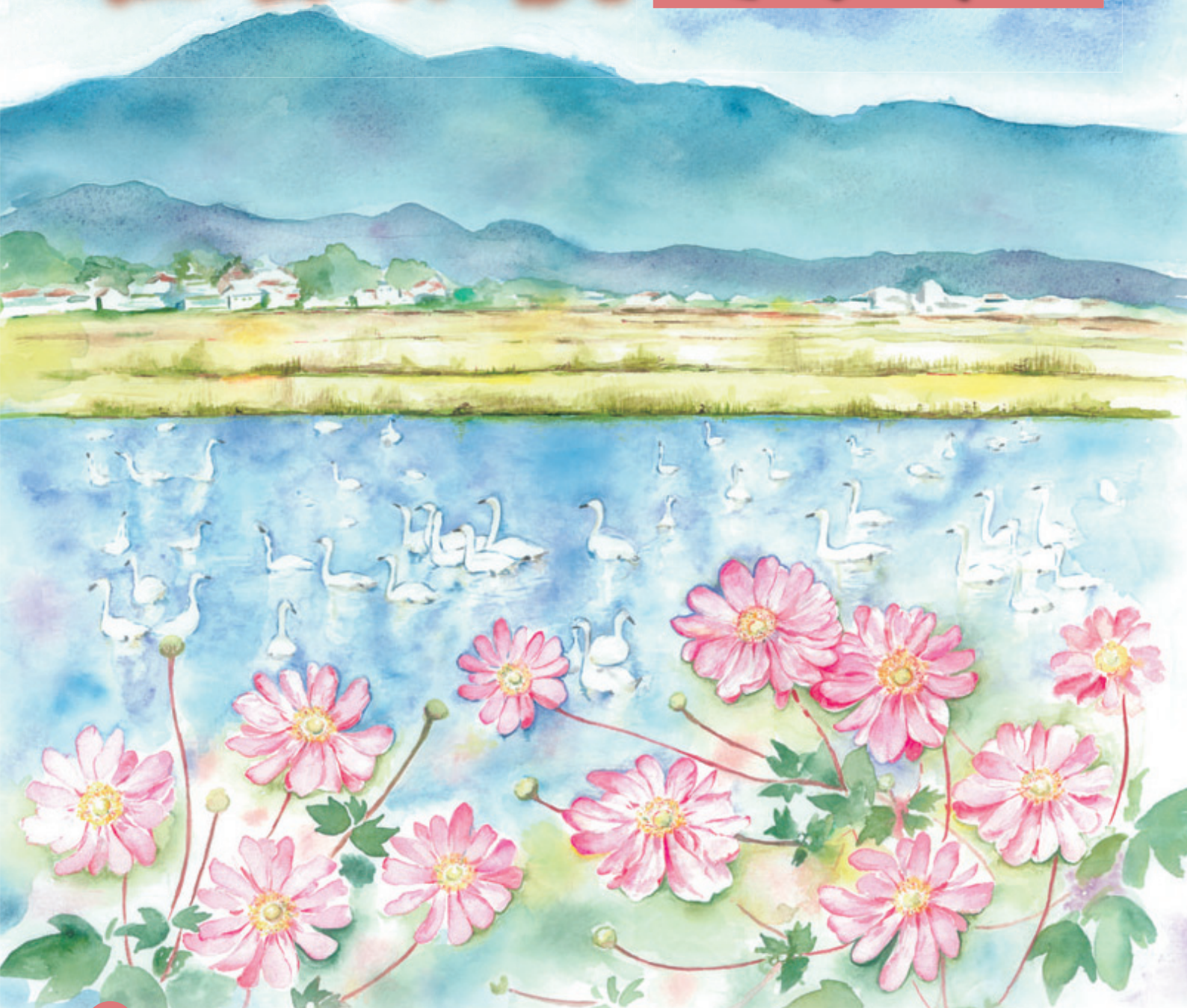
「白鳥とシュウメイギク」illustrated by saori notsu