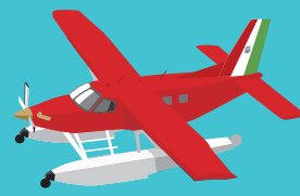
特別塗装機(愛称 ラーラ ロッサ)

水陸両用機「KODIAK100」による遊覧飛行「まつえ空旅」では、中海への離着水を体験できるほか、上空からは日本ジオパークに認定されている「島根半島・宍道湖中海ジオパーク」の雄大な景観や、国宝松江城を中心とした城下町など、水の都・松江のまちなみや神話ロマンを体感することができます。