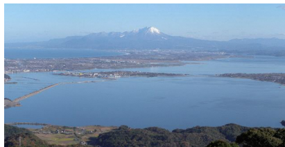
中海に浮かぶ大根島と中国地方最高峰の大山(だいせん)

日本最大の連結汽水湖である宍道湖・中海や島根半島には、古代から文化が根付いており、地質地形遺産だけでなく「出雲国風土記」の自然と歴史に出会うことのできる大地です。