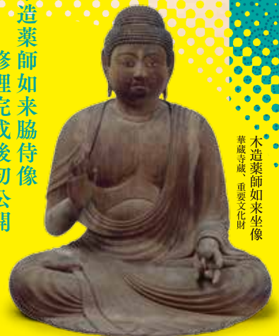
木造薬師如来坐像 華蔵寺蔵、重要文化財