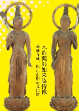
木造薬師如来脇侍像 華蔵寺蔵、松江市指定文化財

めぐって学ぼう スタンプラリー 会期中、スタンプラリー付き 市内指定文化財マップを配布 プレゼントもあります。