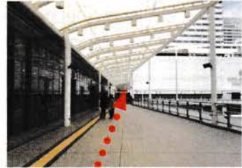
⑥ 広島テレビの横を直進します。