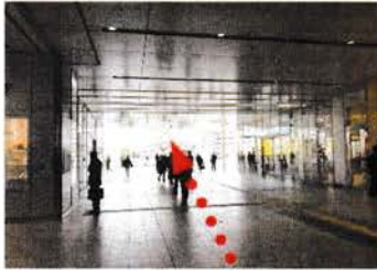
④ ホテルグランヴィア広島の前で右に曲がりま