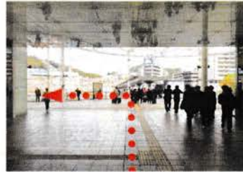
⑤ 突き当りまで直進し左手の階段を下ります。