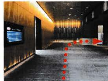
⑨ 入口から直進後右手のエレベーターで3階までお越しください。