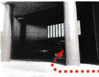
⑧ 交差点に面した位置に正面入口がございます。