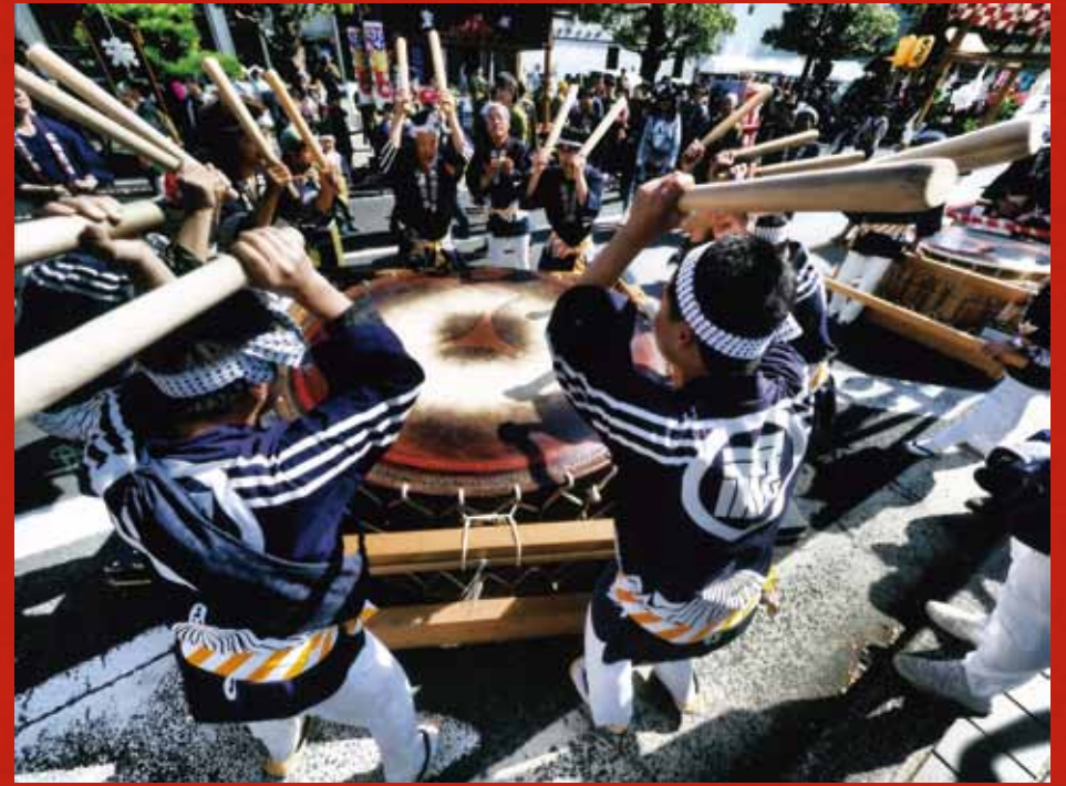
平成30年最優秀賞作品『一斉』 藤江松男