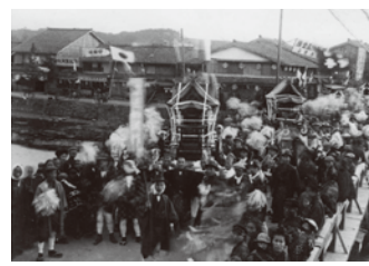
大正4(1915)年大正天皇ご即位のご大典の折に今の形の藪行列が始まった。

出雲地方では太鼓のことを藪といひます。松江の藪行列は、打ち面を上に向けた大きな藪を据えた山車屋台(藪宮または藪台という)を、多数の老若男女が打ち鳴らしながら引き廻る祭りです。