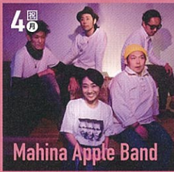
Mahina Apple Band