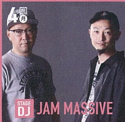
STAGE DJ JAM MASSIVE