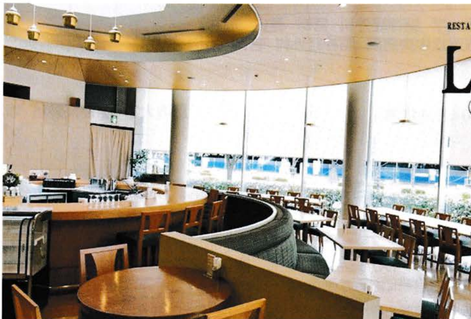
米子コンベンションセンター 1階フロア

ビュッフェ形式にてお料理をご用意しております。 奮ってご参加くださいますよう、よろしくお願いいたします。