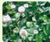
シロツメクサ(5月~8月)