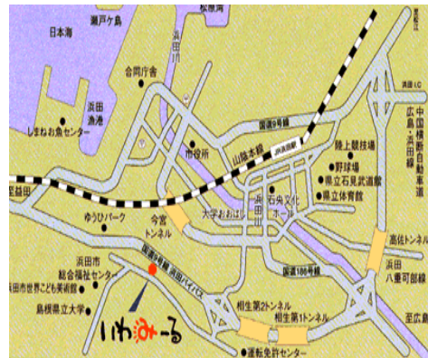
「いわみーる」浜田市野原町 1826-1

■JR 松江駅バス停より南循環線で「県合同庁舎前」下車 (所要時間約 20 分)