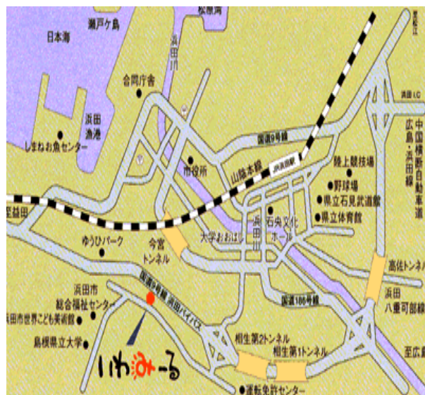
「いわみーる」 浜田市野原町 1826-1

◆JR 松江駅バス停より南循環線で「県合同庁舎前」下車 (所要時間約 20 分)